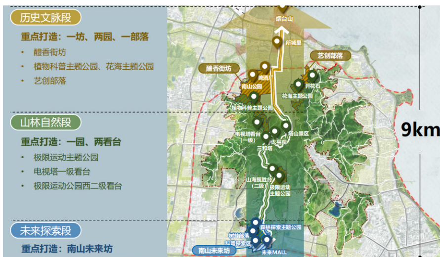
图1 功能分区优化设计图

依托长约9公里“大南山-烟台山”历史文化轴线，自北向南构建起历史文脉、山林自然、城市未来三个特色功能区段。历史文脉段，强化文创主题业态，着力塑造城市记忆与文脉传承的载体。在此建设植物科普主题公园、花海主题公园，打造文化底蕴深厚的醴香街坊以及人气集聚的艺创部落。山林自然段，营造舒适惬意的慢生活体验场景。依托梯田主题公园，打造星空、萌宠、自驾等时尚新潮的营地。深度挖掘竹林寺文化景观资源，重点打造禅养村、梯田园、黑松园、沐道园等，并通过实景演出、互动剧场等形式，创建“遇见山海经”沉浸式体验品牌。同时，建设极限运动主题公园，策划举办山地滑板、自行车和攀岩等极限运动赛事，源源不断地为大南山注入活力。城市未来段，结合森林探索主题公园，打造引领潮流生活的南山未来坊。该区域布局未来商场、科普探索区、森林探索区、树蛙部落等四个功能区，营造出集山野体验与科学探索于一体的未来生活新趣点。具体如图1所示：