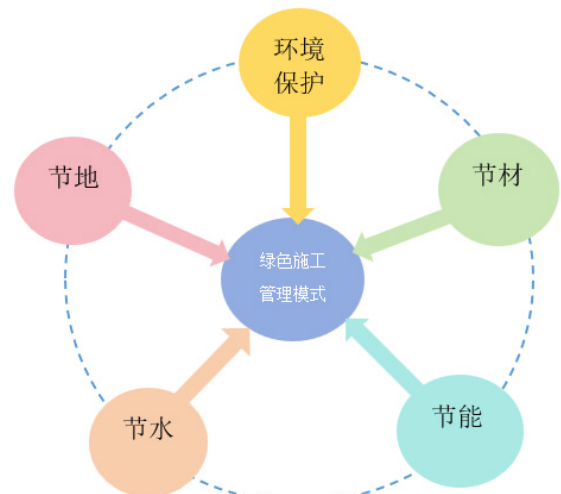
图2 绿色施工管理模式

应用该类材料建设建筑工程，有助于降低建筑物的能耗，减少环境污染，增强建筑物的整体质量。不仅如此，建筑企业在实行绿色施工管理时，还需科学优化传统施工工艺，引进先进的施工工艺技术与设备，提高能源资源利用率，减少废弃物排放。除此之外，建筑企业也可结合施工现场的实际情况，构建完善的资源回收利用机制。要求现场管理人员针对建筑工程施工现场的各种废弃建筑材料、模板、脚手架等物料，进行分类回收与再利用，避免资源浪费，降低建筑施工成本。如，建筑企业可将废弃木材加工成木方应用于保温材料，或加工成木屑用作燃料；可将废弃的钢筋制作成小型构件或工艺品，实现对各项废弃资源的循环利用。