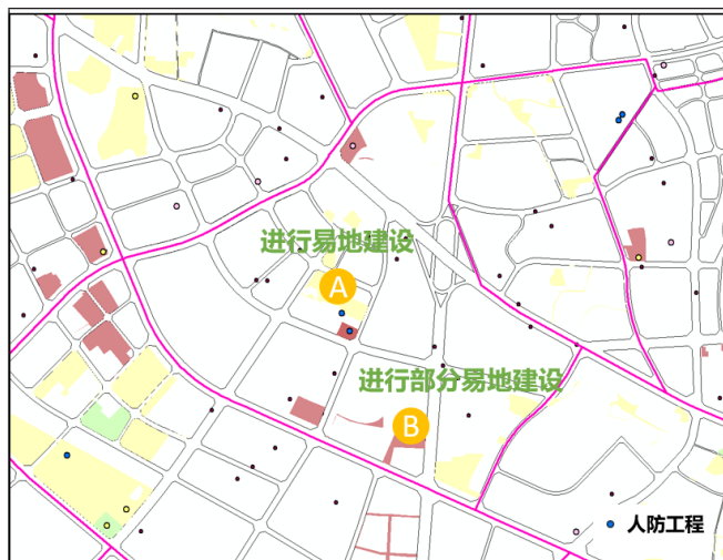
图2 两种易地建设情况示意

借鉴浙江省做法，利用易地建设对人均人防工程面积达标区域进行调控，以控规编制单元范围为界，已建人防工程人均面积达到国家或省人民防空规划控制要求的，新建地块人防工程可易地建设。该指标以经批准的控制性详细规划或人民防空专项规划为准，未编制相关规划或相关规划中不明确的，以国家或省确定的人民防空规划控制指标为准。为保证人防工程服务半径，分为以下两种易地建设情况，新建地块A周边200米服务半径内有人防工程，能够满足掩蔽需求的，新建地块防空地下室可进行易地建设，缴纳易地建设费，从而均衡人防工程布局。若新建地块B周边200米服务半径内无人防工程，无法满足人员掩蔽需求的，通过地块常住人口乘以1.5平方米人员掩蔽工程面积，得到人口需求的二等人员掩蔽工程面积；通过地块建筑总面积乘以建设标准比例得到结建政策需求的二等人员掩蔽面积；上述两者面积之差为可易地建设面积。