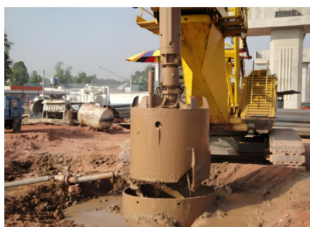
图1 钻孔灌注桩检测

在基础桩基检测技术中，以钻孔灌注桩为研究对象，有其自身的特点。这类桩基础因其结构复杂、受力关键等特点，对检测方法的选取也有较高的要求。如图1所示。高应变法是目前已被广泛采用的一种检测方法。本项目提出了一种基于应力波理论的桩顶瞬时高能冲击载荷的新方法，其检测速度快，操作简单。