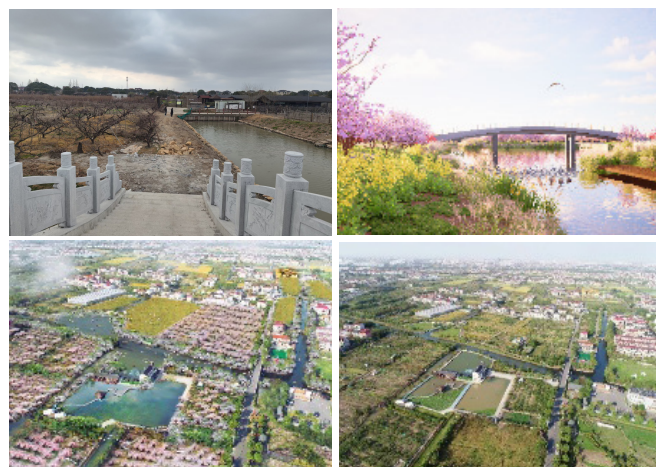
水系贯通和村组改造前后对比

近期重点建设“桃花新扇”门户区，塑造区域品牌形象。通过联通断头水浜、修复水岸生态、强化“羽扇经骨”；营造微坡曲水、延伸林间小径，打造“桃花扇面”，整体营造一幅“桃花扇”新画卷。