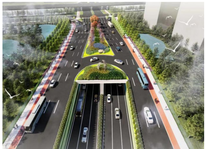
图2 凤凰大道快速化改造工程完工效果

施工团队精准地制定出解决方案。如在发现交通堵塞问题后，施工方立刻与交通管理部门合作进行交通疏导工作，设置临时性交通信号灯、指派专人指挥交通等。据统计发现，这些措施的应用使施工材料运输受阻时间降低了约35%，大幅强化了材料运输成效，为施工进度争取了宝贵时间 [4] 。目标导向则要求施工团队全方位把控施工工期的整体目标和各个环节的分目标。将总工期24个月详细化解成为若干个关键节点目标，如隧道开工、桥梁基础完成等，对每个节点都设定严格的时间限制。这种工作方式如同为施工进度绘制出了一张精确的地图，保障工程可以按计划有序推进。结果导向更加注重最终的施工成果，主要问工程按时交付、质量达标为评估准则。经由对各阶段施工结果展开严格评估，有效调整施工方式，促使整体施工进度偏差控制在10%以内，实现工程可以在预定时间中高质量完成。