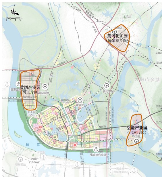
图4 城市产业园区规划布局图

在用地规划布局上，高水平修编控制性详细规划，对园区各项用地进行分区规划管理。优先保障重大项目用地，将指标安排与项目体量、环境容量、开发强度等相挂钩，突出弹性指标利用标准。盘活闲置低效用地，强化资源循环高效利用，对低效用地实施“单元图则+地块图则”的管控模式，从台账式管理向空间数据管理转变，打造土地“整体智治”新样板。提高产业项目用地容积率，结合黄冈实际，最大限度提高产业用地容积率的下限指标，推广“工业上楼”“带方案出让”等创新土地利用方式，进一步提升投入产出效率，促进园区集中紧凑发展。鼓励土地混合开发和空间复合利用，引导单一功能向产城融合模式转变，提升存量土地节约集约利用水平和空间整体价值。