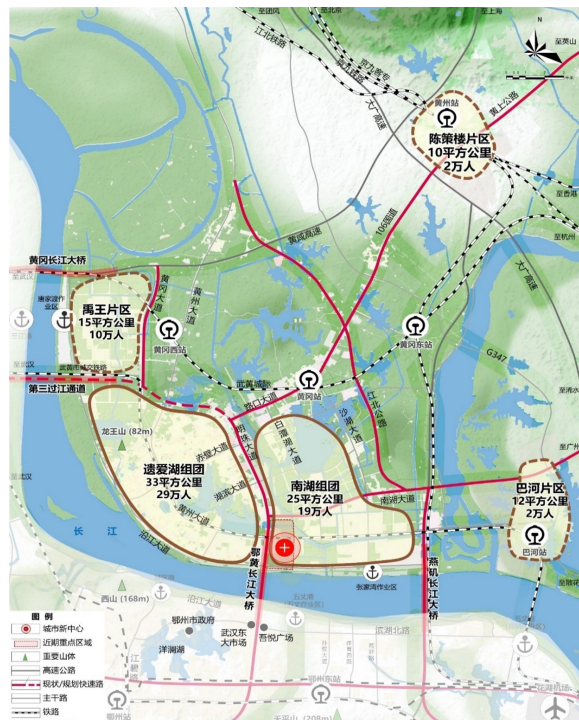
图2 主城区空间结构规划图

通过城市中心重新布局来带动老城区人口疏解和吸引外来人口聚集。考虑鄂黄长江大桥是联系黄冈与鄂州的重要通道，桥头片区又是黄冈新老城区衔接的枢纽地区，并且该片区有新增用地和存量更新用地约3.1平方公里。规划在鄂黄长江大桥桥头片区布局城市新中心。新中心集中布局四大功能区，一是以黄冈中学历史博物馆、教辅研学为主导功能的教育展示培训区；二是以东坡文化、李时珍中医药文化、名人将军馆为主导功能的文旅体验区；三是以星级酒店、会议会展、商业综合体为主导功能的城市商业服务区；四是以黄冈第二高级中学、实验二小以及居住生活为主导功能的教育及生活服务区。（如图3所示）