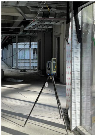
图一 三维激光扫描技术

中应得到充分应用，通过技术创新提升检测水平。非破损检测技术如超声波、射线、电磁波等物理方法可用于混凝土内部缺陷检查，钢筋位置探测，焊缝质量检验等关键部位检测。图一所示，三维激光扫描技术能够精确获取建筑物几何尺寸数据，检测结构变形与位移。智能监测设备如应变传感器、倾斜传感器、位移传感器可埋设于关键构件中，实时监测结构受力状态与变形情况。项目现场应配备便携式检测仪器，如回弹仪、钢筋位置仪、测厚仪、平整度仪等，满足日常质量检查需求。