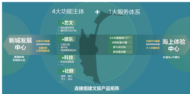
图1 四大旅游产品体系示意图

通过“艺文、娱乐、科技、社群”四大旅游产品体系的互补构建的产品体系，打开新区知名度、助力城市发展。（图1）