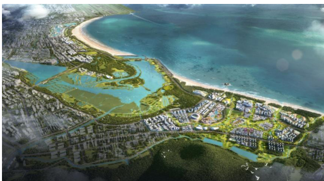
(图5) 整体空间示意图

北部——艺术湖链,凸显“旅游+文化”,是城市文化艺术功能的延展和互补,通过系列公共文化艺术节点打造,形成新区滨海的艺术新地标,演绎新时代福州文化。围绕湖链发展旅游服务、购物娱乐、渔人码头、商务休闲、温泉度假等功能,利用海丝国际剧场,现代艺术馆,渔人码头等,共同塑造水岸文化高地,打造滨海城市形象的展示窗口。