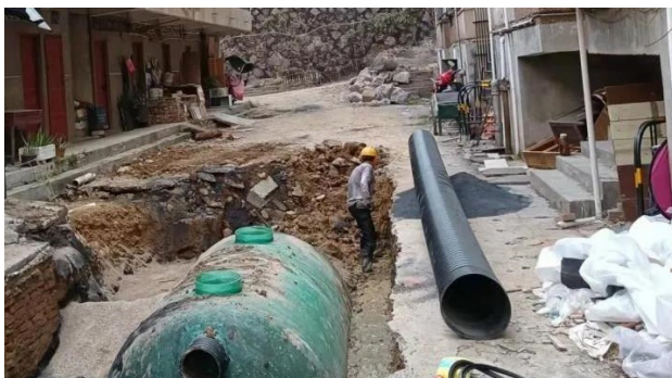
图1：某小区排水管网改造

该小区建于1985年，占地面积约2.5万平方米，共有12栋居民楼、680户居民。小区原有的给排水管道为铸铁管和混凝土管，经过多年使用，管道内壁严重腐蚀，出现多处渗漏和堵塞现象。给水管网漏损率高达35%，污水管网排水不畅，雨季时常出现污水倒灌至居民家中的情况。为改善居民生活条件，2023年城关区对该小区启动了给排水管道改造工程（见图1）。