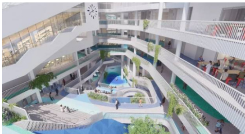
图 1：小学分区示意图

察自然生态系统的机会，成为开展生物科普教育的天然课堂，而铺设的太阳能光伏板每年可满足 20% 的校园用电需求，让学生直观了解清洁能源利用以增强环保意识，实现生态效益与教育功能的双重叠加。这种垂直分区模式，成功使学校在有限用地面积上实现了功能空间的高效堆叠与合理分配，极大提升了空间利用率，为高密度区学校空间规划提供了极具价值的新思路。如图 1 所示：