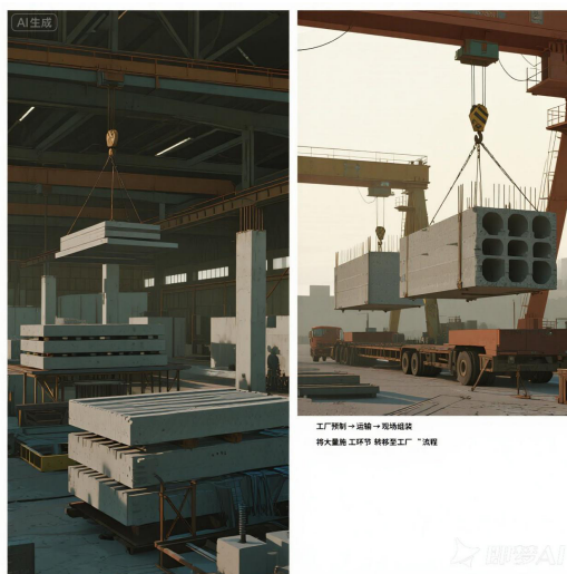
图1 装配式建筑构件工厂与现场组装图

装配式建筑结构的抗震需求源于其自身构造特点。预制构件之间的连接部位是抗震薄弱环节，需要保证节点具有足够的强度和延性。节点在承受拉力、剪力和弯矩共同作用时，不能发生脆性破坏，需具备一定的塑性变形能力。地震作用下，结构各部分会产生相对位移，连接节点需能够吸收部分地震能量，减少结构主体损伤。