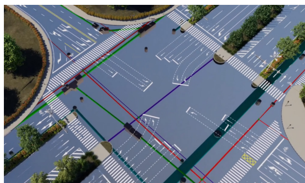
图 2 各专业模型合模

理解复杂数据并做出科学判断，借助云计算和边缘计算技术应用确保其高性能及实时响应能力。