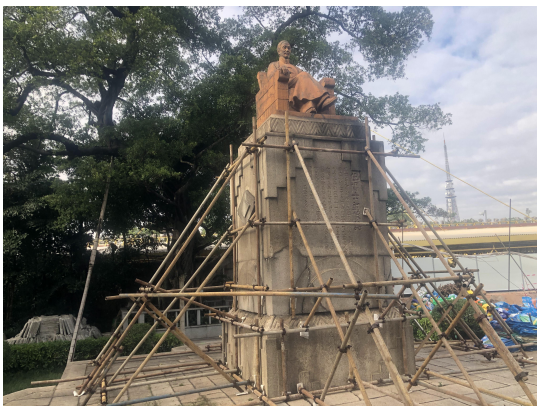
图3 预加固伍廷芳纪念雕像

c、伍廷芳纪念雕像，采用钢管架进行预加固保护，防止施工中意外碰撞伤害墓体上部结构（见图3）；