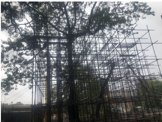
图4 坡顶树木砍伐脚手架搭设

d、对坡顶需要砍伐的树木，编制砍伐方案，取得相关部门批准后，围绕高大树木本身分层搭设脚手架（见图4），并做好坡脚民房及文物主体的遮挡保护，然后自上而下，分层肢解树体，再自上而下分层拆除脚手架，直至完成树木砍伐工作；