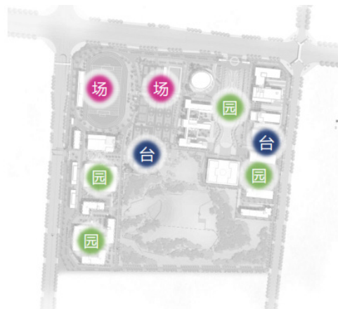
图 3：景观“场、台、园”布置图

以“自由灵动的空间”理念为主旨，进行“山水园林生态校园”的立体规划设想，利用校园现有大地形高