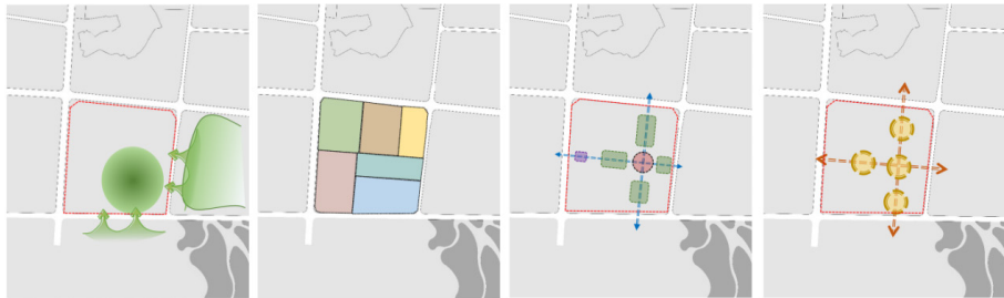
图 1：园区肌理分析图

基于“文脉延续的意蕴性”拥有丰富阅历的“文脉延续中心”，作为首批国家历史文化名城，遵义市城市空间本身就承载着丰富的红色文化，将遵义市城市文脉意向融入校园空间设计，赋予校园空间历史感，以“生命延续”、“医养服务”为校园宗旨，通过每一处设计诠释对文脉的敬畏与延续，提炼出“文化、积累、延续”三个主题词，展现项目的内涵与魅力。