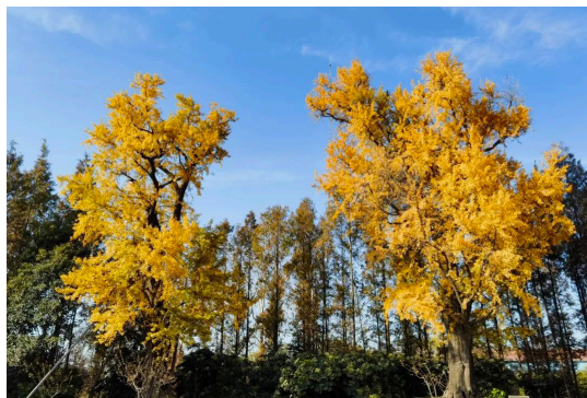
图 1 罗店镇毛家弄村银杏树

造古树园等举措，改善了古树生长环境 [5] ；对具有重要历史文化价值的古树，如罗店镇毛家弄村树龄近 500 年的“宝山树王（银杏）”（图 1），与钱世桢文化公园修缮相结合，使其成为传承地方历史、寄托乡愁的文化地标。