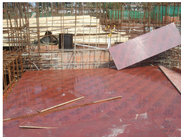
图4 竹胶模板搭设现场

下，立杆间距600mm，高度 > 3\text{m} 则立杆间距为500mm，底部要垫上 50\text{mm}\times 100\text{mm}\times 200\text{mm} 方木；按照梁高对梁底立杆进行间距调整，梁高不超过800mm，间距设为800mm。若梁高 > 800\text{mm} ，间距为600mm，顶托伸出需控制在300mm以内。先在地面拼装剪力墙模板，再进行吊装，用线锤校准垂直度，最后用对拉螺栓固定；采用水准仪校准梁模板标高，允许偏差为 \pm 2\text{mm} ，用斜撑对梁模板水准仪校准标高（ \pm 2\text{mm} ）后的侧模进行固定，完成操作后用全站仪复核，于根部浇筑50mm厚C15挡水坎来防止漏浆。