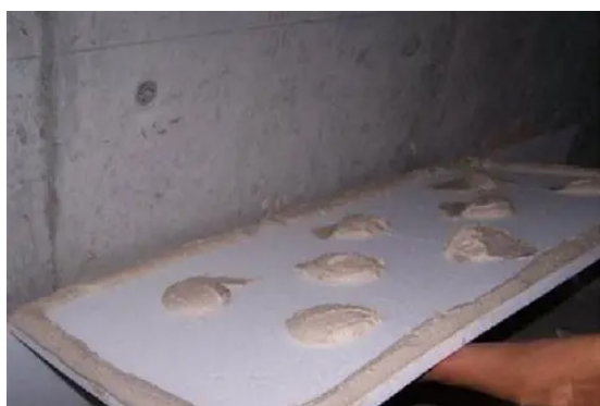
图3 点框法涂抹粘结砂浆