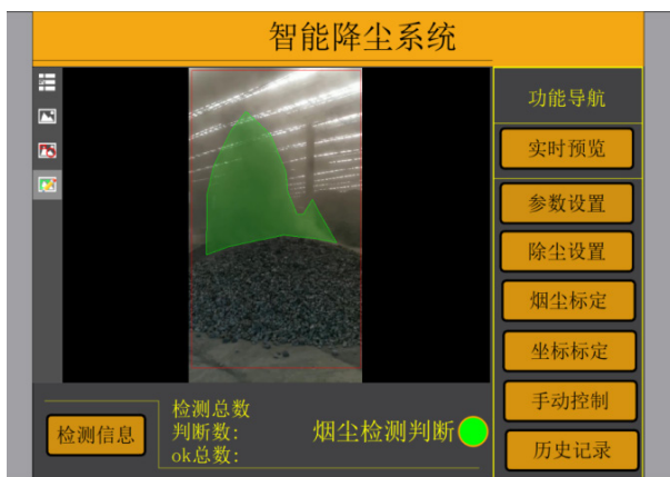
图5 智能降尘系统功能

土方开挖工作开展前，要搭建2.5m高的彩钢板围挡，围挡底部砌300mm的挡墙，围挡顶部装设喷雾系统；采用密闭方式运输渣土车，在出厂前要经过8m×3m洗车平台的冲洗，三级沉淀池的水循环利用率达60%，行驶车速不超过30km/h；对裸露的土方覆盖2000目防尘网，用5kg沙袋压牢。结束工作前喷施抑尘剂（1:50的比例进行稀释，用量为2L/m 2 ），并采用吸尘器清理作业面。同时，项目采用AI智能降尘协同体系（功能如图5），在施工地带布置6组PM10在线监测仪，若监测的数值超过了0.12mg/m 3 阈值，系统立刻自动开启围挡喷雾、道路洒水车以及料仓通风除尘设施，达成“超标就降尘”的精准化反馈；采用新型生物基的抑尘剂，跟传统化学抑尘剂相比对，降解率可提升至超过95%，而且抑尘的有效时间拉长至72小时，既减少了药剂投放的频率，又降低了对周边土壤和水体构成的影响。