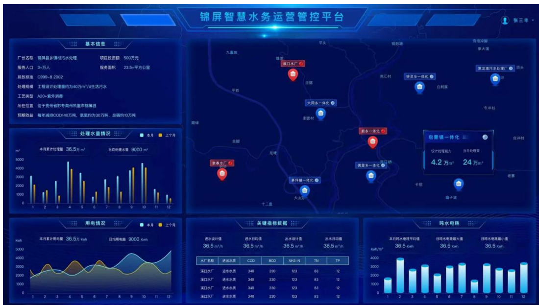
图1：海市税务局构建的“智慧水务平台”

为提升水利工程质量技术监督管理效果，需要充分利用物联网、人工智能和大数据等数字化技术，赋能水利工程施工理念、监督方式和监督模式的转变过程。通过数字化赋能的方式，实现水利工程技术质量监督的现代化，提升监管效能。首先，需要构建一体化数字监督管理平台，整合分散的信息系统，构建覆盖水利工程项目全生命周期的数字监督管理平台，确保各级监督管理部门连通，参建单位协同。例如：珠海市税务局构建的“智慧水务平台”，集成了分散的信息数据，提升了监督管理质量，平台建设情况如下图1：