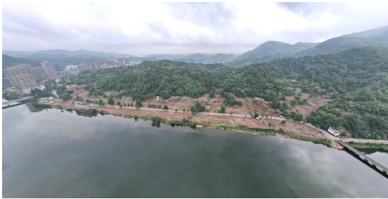
图5 康养社区规划建设前