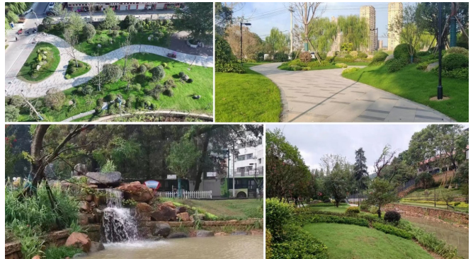
图 1 观音冲、梅园两大河涌规划治后

了交通拥堵，还加强了区域间的经济往来与人员交流。观音冲、梅园两大河涌治理项目，通过清淤疏浚、生态护岸建设以及污水截流等一系列措施，使河流水质得到显著提升，水生态系统逐步恢复。