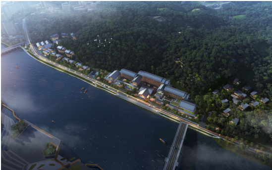
图6 康养社区规划建设后