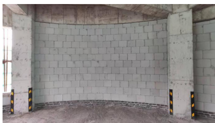
图 3 浇筑效果图