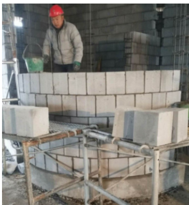
图 2 现场浇筑

另一位小组成员提出通过 REVIT 软件建立三维 BIM 模型，运用砌体排砖模块，结合墙体砌筑方案及相关规范进行三维排砖，并导出施工图及材料表，辅助现场集中加工。通过预先排砖，大大减少了对技术工人的依赖，避免了因工人水平差异导致的砌筑质量差异，整体提升了砌筑质量。同时，通过集中加工切割，使得砌块的损耗率下降了 2%，节约材料成本 5000 余元，减少了砌筑区域垃圾的产生，节约了清理费用，满足绿色文明施工的要求。