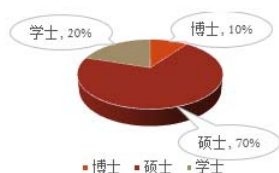
图2 中心教师学历结构