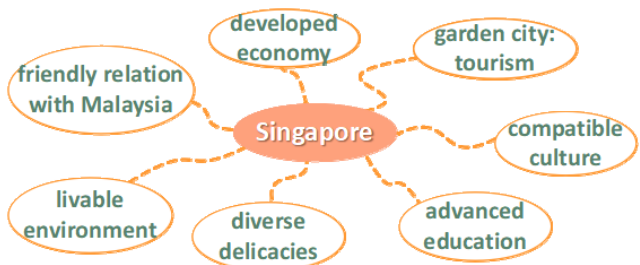
图1 视频对新加坡的介绍内容

读前阶段,笔者以一段介绍新加坡的短视频导入话题,要求学生在观看时快速记下视频介绍的内容。观看结束,笔者在PPT上呈现思维导图(图1)进行总结。这一环节讲解了速记技巧,激活了背景知识,也激发了学生的好奇心,为阅读环节做好充足的知识储备和心理准备。