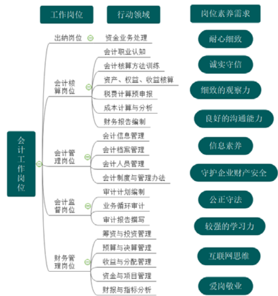
图2 会计典型工作岗位

思政元素经常存在于我们教学的过程之中，教师们要有意识的发现，引导学生。比如基础会计里涉及的我国会计的发展以及在历史上的成就以及为世界会计的