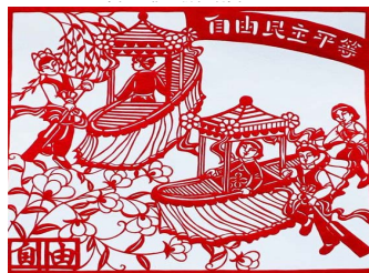
图2 核心价值观剪纸造型