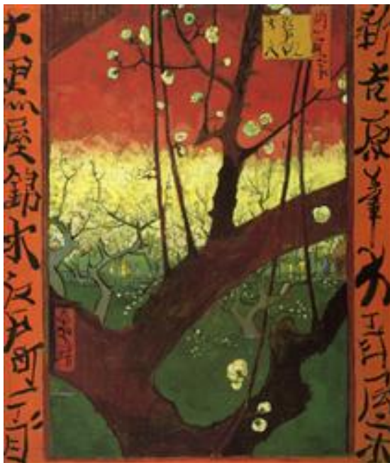
图1.1 《日本料理》文森特·梵高受东方绘画影响的创作

这种模仿客观对象的观念保持到19世纪却突然受到严重的挑战。照相术的产生和普及对模仿写实的艺术构成了相当的威胁,造成了艺术家们的危机感。恰好这时,日本的浮世绘和中国的绘画艺术传到西方,东方艺术的表现性、平面感使西方艺术家眼界大开,他们看到,原来非写实的、平面的和写意性的东方艺术同样有魅力。模仿写实仅仅是一种艺术观,冲破这种传统艺术观,艺术将会走向更为广阔的天地。塞尚、梵高等后印象派画家首先冲破了这种传统观念的束缚,强调主观精神的表现。至20世纪,这种观念得到进一步的发展。摄影、电影、电视等多种现代化手段的出现,使人们认识到美术不再是反映和记录客观对象的唯一形象化手段。尼采、柏格森、弗洛伊德等人的哲学观点及学说的影响,使人们的思想从对客观世界的关注转向了对人的内心世界的兴趣,发现了世界上最深奥最神秘的东西原来就是人的内心。模仿写实描绘的只是客观真实,表现主观感情的绘画描绘的则是心灵的真实。这种心灵的真实,正是艺术表现的新领域和新天地。于是,表现心灵的真实,表现纯粹的主观情感,成为20世纪上半叶最具突破性的观点。野兽派、表现主义、超现实主义等流派的出现,就是这种艺术观的具体实践。