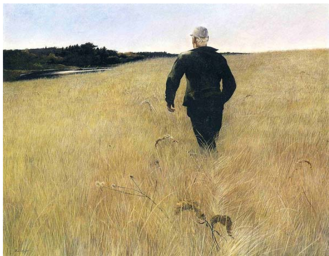
图3.2 《草原上的行人》 安德鲁·怀斯

怀斯说过：“画中主题的内容越少，画的就越好”不难发现，优秀的一幅大师作品中的主题表达都尤为纯粹，想说的内容越多就越说不明白。怀斯的代表作《克里斯提娜的世界》就是这样的一张场景普通没有多余内容的画作，但却用简练的主题表达地非常深刻；另一幅画荒野中的行人，内容也很普通，遥远的树林，近处的行人背影，怀斯父亲也曾指出这张画要加些什么，类似手里拿着猎枪或是空中的老鹰，但怀斯本人拒绝了 this 提议，他用他独特的绘画内核——“高度提炼的抽象”，赋予他画作更深刻的表现力，例如出现在他其他画中的对象——孤屋、老人和鸟兽，都含有一股静寂与淡淡的哀愁、洋溢着动人肺腑的诗意，他以敏锐的感触，精致的写实技巧，捕捉视觉的一瞬。怀斯创造一种属于个人的主观艺术，以一种连续而持