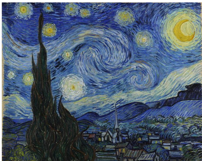
图2.1 《星空》文森特·梵高

我们常常能在他的作品中看到许多的蓝色,那他画面中的这些颜色是否有特别的寓意?蓝色代表着忧郁,身陷病痛折磨且不被世人理解的梵高深受打击,倍觉