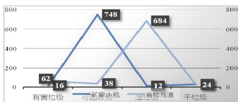
表一（问题：矿泉水瓶、食物残渣属于什么垃圾？）

根据表一数据所示，清楚矿泉水瓶属于可回收物的受访对象比例占到全部受访对象的 92.57%，而清楚食物残渣属于湿垃圾的受访对象比例占到全部受访对象的 84.65%，说明目前居民对于生活中常见的垃圾，已经能够较全面的掌握其垃圾分类的类别。