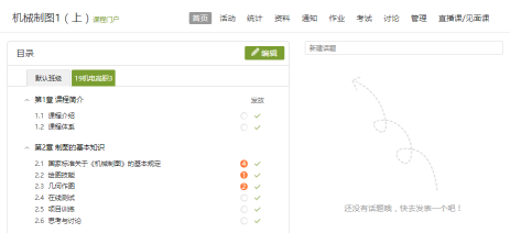
图1 搭建《机械制图》课程目录