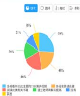
第6题: 您对批判性阅读的了解有多少? (单选题)