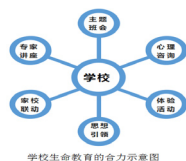
学校生命教育的合力示意图

教育是重塑生命的工作,生命教育是育人教育的基础。疫情复学以来,学校全面落实立德树人,提高教育质量,以生命教育为魂,积极构建学校文化,全力打造生命教育的育人环境,让每个学生成为最好的自己。