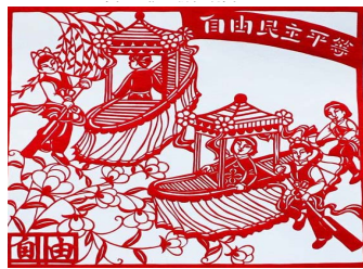
图2 核心价值观剪纸造型