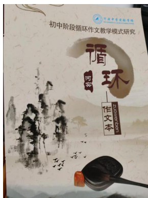
九年级循环作文题目

九年级的中考备考训练内容在教材基础上以中考考题和分主题训练为主。在九年级时循环小组是按照不同水平分组，那么内容的选择和要求也要结合本班水平和对他们的具体提升要求为出发点进行选择。如：