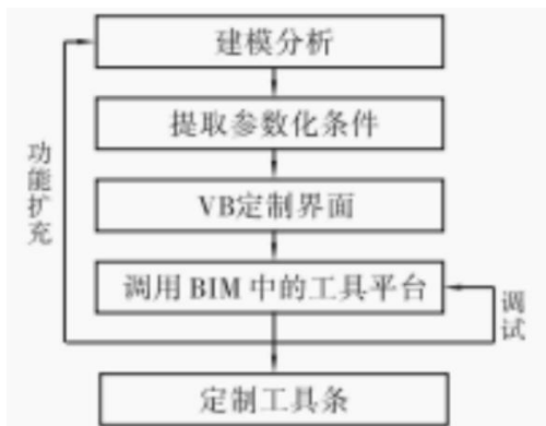
图二 BIM技术设计流程