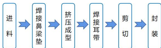
图1 口罩全自动生产流程

利用多媒体资源向学生展示口罩全自动生产的流程及各部分的控制原理,一方面让学生了解口罩生产的具体步骤,如图2所示,理清控制思路,便于顺序控制编程程序的设计;另一方面展示我国口罩生产设备的智能化,为我国乃至世界的疫情防控做出巨大贡献,激发广大青年学生的爱国情怀。