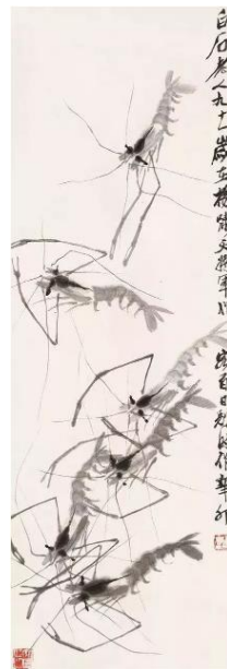
齐白石 102.5cm×34cm 1951年 国画

从艺术家来说，革新可以表现为对他人的超越和对自我的超越。高更和梵高对印象派绘画形式的超越或者其后的美国抽象主义对莫奈晚年作品艺术形式的超越表现为对他人的超越。莫奈十九世纪六十年代对过去风格的革新则表现为对自我的超越，相似的还有齐白石“衰年变法”。