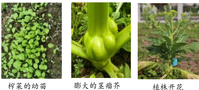
图 4 榨菜的一生

些拓展性作业，让学生在实践中提高认知，提升能力，实现多学科融合，体现减负增效，促进学生全面发展。比如图3，在学习了细菌和真菌之后，设计不同类型的作业：回家利用新鲜蘑菇制作孢子印画，观察孢子的颜色和大小，让学生屡做不鲜，意犹未尽；在带领学生探究细菌和真菌的培养中，学生发现培养基上的细菌菌落和真菌菌落在形态、大小、颜色等方面的区别，这个时候布置学生完成摄影作业，即用手机拍下单个细菌或真菌菌落，不要求学生能用多么专业的手法进行拍摄，主要是让学生能在过程中分辨细菌菌落和真菌菌落，在此过程中学生看到了单个菌落的形态千奇百怪，发现细菌之美；有的学生以培养基为画布，以菌液为画笔，利用菌液涂鸦、作画，感知细菌之趣；有的学生为观察到的细菌进行段落描写，将细菌拟人化，写出了细菌和真菌的特点，有的还带有故事性情节和意境，体会细菌之奇，象这样的作业能极大激发学生兴趣。