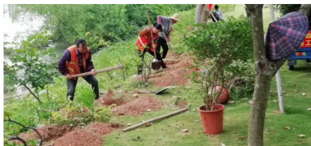
图1 市政园林绿化养护现场图

市政园林绿化养护管理简单地讲就是对城市建设发展过程当中的生态规划及相关工作的管理,如图1所示。例如:实现绿地功能、绿地规划、城市生态效应。人们要将生态环境当作发展的重点,并通过园林绿化当中的经济效益以及相关的生态环境理念加以科学合理的分析,从而实现城市生态环境的可持续发展。现阶段我国的城市园林绿化养护管理工作已经得到了一定的发展,且形成了一个完整的生态链,这也是城市做好绿化管理工作的重要基础。在城市园林绿化管理过程当中,城市发展水平会对绿化管理质量有直接的影响,这也关系到这座城市当中人们的生活质量 [3] 。为此我国也出台了許多政策加以引导并采取了許多配套措施以提高城市园林绿化养护管理工作的质量。但现阶段我国一些欠发达城市的园林管理相关工作实施情况依旧不容乐观。最明显的问题就是投入与效果不成正比,绿化效果非常的不理想,且相关制度虽然有所执行但并没有落地,以上这些问题都导致了我国城市园林绿化养护管理工作发展较为之滞后。