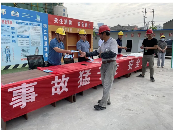
图2: 建筑施工单位安全教育活动现场

该企业工会主动参与到经营管理工作中, 将群众组织的自身优势充分发挥出来, 基于企业阶段性重点工作, 开展多元化形式的劳动竞赛活动及安全教育活动, 如下图2所示, 提高施工作业人员的质量意识、安全意识和责任意识, 促使其养成良好的施工作业习惯, 保证企业生产经营的有序性。