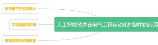
图3 人工智能技术在电气工程自动化控制中的应用

零件出现丢失情况,则必然会导致电气设备的应用及运行,所以在工作人员应用电气设备时,需要对电气设备提前做好准备工作,同时还需要不断加强对电气设备的诊断力度,进而有效保障电气设备的安全运行。如果发生故障的地点处于城市中心或重要的交通枢纽,长期的道路开创查修会给市民的出行带来不便,导致生产生活节奏紊乱,拉低了个人和城市的整体运行效益。通过人工智能相关设备的应用,维修监测的人员可以快速准确地找到问题所在,并且应用相关设备实施方便快捷、安全有效的维护,极大降低用料成本和各项资源。且可以应用人工智能系统对故障区域进行深度分析,降低类似风险再次发生的可能性。