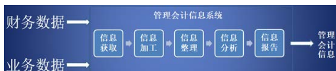
图2 管理会计信息化系统示意图

在数字经济时代之下，信息技术在经济领域中得到了广泛化的应用，建筑行业的发展带来了崭新的发展方向，当前推进建筑企业信息化建设成为了建筑领域发展的一种新常态。而推进建筑企业信息化建设对于提升企业管理效率与质量非常的关键。因此，在建筑企业财务管理方面应用管理会计，则需要重视对信息技术的依赖，构建完善的管理会计信息系统（如图2），全面发挥管理会计的优势强化建筑企业财务管理水平。首先，构建完备的信息系统。目前，在建筑企业信息化建设的过程中，必须注重业务信息系统与财务信息系统能够的衔接，实现业务信息与财务信息的高度共享，从而为建筑企业经营管理的决策提供科学的依据。其次，以信息数据为支撑 [9] 。