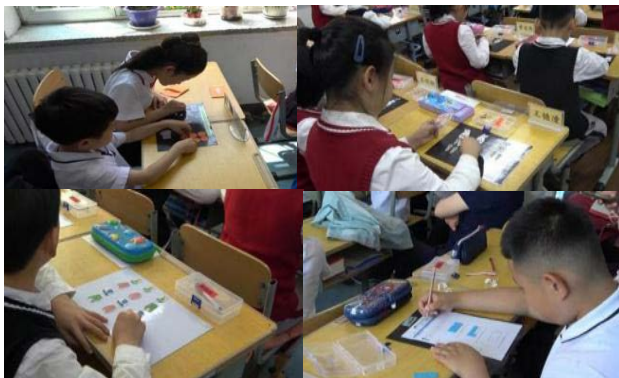
图1《分扣子》、《分物游戏》、《搭配中的学问》、《长方形的面积》磁力板呈现学生思维过程

在小学数学活动课中,学生都会经历操作体验的过程即“猜想-验证-结论”这三个阶段,再这几个阶段的学习中,学生的思维会产生诸多变化,还会产生大量可归纳的学习素材,那么怎么样才能将学生的思维可视化?将不同的学情呈现给全班呢?基于此,本研究研发了黑色双面磁的磁力板,提供学生有磁力的学具,将学生的思维结果呈现在黑色磁力板,帮助学生归纳学习。