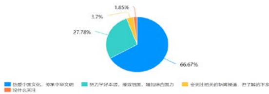
图2 高职院校大学生对爱国主义的体现

如图2所示,通过调查发现66.67%的高职大学生认为爱国主义的体现为热爱中华文化,传承中华文明;被调查中27.78%的同学认为爱国主义的体现为努力学好本领和知识、报效祖国、增加综合国力;参与调查的3.7%的同学认为爱国主义的体现为会关注相关的新闻报道,但是他们平时对新闻报道了解的较少;参与调查的1.85%的同学认为爱国主义就是什么都不关注。通过调查高职院校大学生对爱国主义的体现认识可以发现,当代大学生认识爱国主义的体现主要表现为对祖国的高度认同,努力学好本领、报效祖国,这也进一步反映了高职院校大学生的爱国主义不仅仅是感情上的认同,更是行为上付诸。