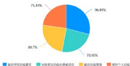
图3 疫情形势下高职院校大学生对爱国主义的体现

变化的。爱国主义的主旋律是热爱祖国文化、传承中华民族，但在特殊的疫情形势下，我们将赋予爱国主义更多的内涵。在疫情形势下，高职院校大学生，他们对爱国主义的体现也有新的认识。如图3所示例，通过调查发现（多选题），在疫情形势下高职院校大学生认为爱国主义体现主要为配合学校防疫要求、积极参加防疫志愿者活动、配合防疫管理、做好个人防护等，分别占被调查学生人数的96.49%、78.95%、80.7%和75.44%。通过数据可以看出在新冠疫情形势下，当代大学生对爱国主义的体现又增加了新的内容，维护祖国利益。在特殊形势下，积极配合防疫要求，不给政府、学习、社区增添麻烦，积极投身志愿活动中去，积极配合防疫工作。