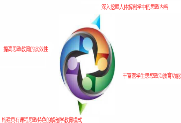
图3 在人体解剖学中融入课程思政元素

无论是针对任何教学单元的教育工作都需要充分切合专业课的内容、课程思政元素以及教育目标这三个方面, 确定更为详细且具体的教学方案。选取科学合理的授课方法, 实现对思政元素的有效呈现, 比如直接讲解、多媒体视频以及实践活动等, 同时在科学合理的节点为学生展示思政元素 [9] , 以此来促进人体解剖学课程教学和课程思政的相互渗透融合, 这样可以真正地实现潜移默化地传递, 为学生的专业认知能力的成长和发展提供坚实的支撑作用, 切实有效地解决可能会出现彼此相互背离的情况, 这对学生的综合成长和思想认知能力的发展而言, 促进作用是不容忽视的。