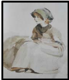
噬鸟的猫 毕加索 索夫克郡的学生 约翰·康斯特布尔

而约翰·康斯特布尔的作品《索夫克郡的学生》则画出了一个乡下女孩正忧心地望着为自己画像的画家。引导学生看画面中的铅笔线条，它们轻柔得几乎看不见了。与前面凶残的猫相比较，你是否感觉到这个小姑娘当时害羞、胆怯、忧虑的心情了呢？