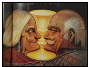
偏执的脸 萨尔瓦多·达利 天长地久 奥克塔维奥·奥坎波

房子、树木、围墙等组合在一起形成了一个新的图像——一张侧面的脸。画家运用他们的手法挑战我们看画的思维。这些奇特的视觉图形让学生觉得有趣极了，特别感兴趣！画面中的正负形、元素替代等方法，打开学生的思维。