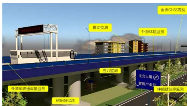
图2 桥梁养护监测设备

桥梁养护单位应当积极引进先进的管理理念,转变传统的养护工作模式。事实上,在问题发生之前,就采取预防养护的措施,比在问题发生后再进行维修成本要小得多,同时,进行预防养护操作还能及时排除安全隐患,尽可能地可能地将桥梁质量事故从源头上得到妥善地解决,有效避免桥梁施工质量问题造成的问题,能够在最大程度上发挥出桥梁养护工作的作用。同时,养护单位还应当做好培训工作,除了要转变养护工作人员的传统理念,也要体现在实际行动中,从而加强对桥梁养护巡查力度(如图2)通过智能化的检测技术,对桥梁进行方位的监测,从而及时发现和解决安全隐患,保持桥梁的正常运行状态。