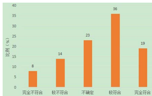
图2溺爱型家庭教养方式各个程度得分所占总分比重

从图1的饼状图中，我们可以清晰的看到，较符合民主型家庭教养方式的家长占了35%，在五种程度所占比重最大，说明较多数家长在教养孩子方面还是比较民主的。