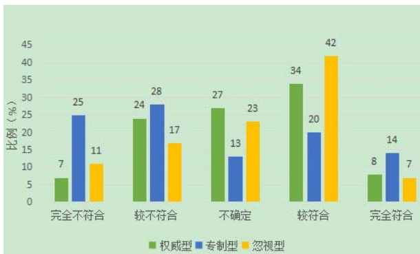
图3权威型、专制型、忽视型家庭教养方式各个程度得分所占总分比重

由图3我们可以看到，偏向于忽视型和权威型的教养方式是占大多数的，较多家长不太关注孩子，但是较多的家长也不会霸道专制。