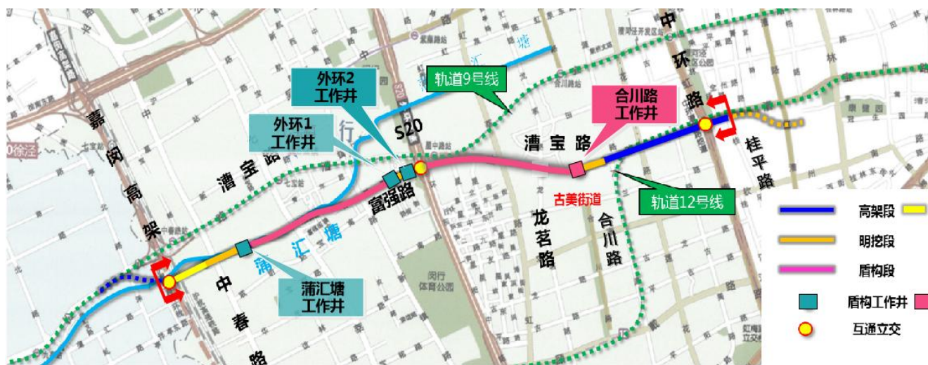
图1 项目施工规划图

隧道工程中所用盾构设备系统组成复杂，其中包括程序控制系统、起重装置、钢结构、机械传动系统、电气系统、液压装置、通风系统、冷却系统等等众多子系统，运行中某子系统若故障发生，盾构系统的整体使用效果都将遭受影响。为在隧道建设中规避此情况出现，设备管理人员必须尽其所能，恪尽职守，落实其设备管理权责，做好盾构系统的维保及日常管理，严格遵守设备管理与养护并重原则，注重事前的预防控制，应该各先进监测手段确保工程盾构系统运行状态良好，进而为工程盾构作业的顺利推进开展保驾护航。