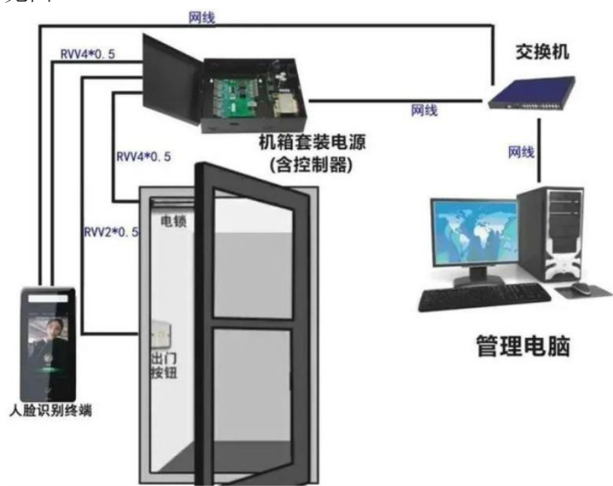
图1 建筑电气弱电门禁系统示意图

在当今社会，弱电系统已成为建筑的神经中枢，承担着监控、通信、自动化控制等多项任务。因此，弱电系统的精确安装对于建筑的智能化运营至关重要。弱电系统的安装技术包含了多个方面，包括但不限于网络布线、综合布线、安全监控和智能控制系统的安装。技术人员需要根据施工图纸和相关标准进行精确施工，同时确保系统的兼容性和扩展性，为将来的升级提供可能。弱电系统安装过程中的另一个重点是保证信号的稳定性和安全性，避免信号干扰和信息泄漏，确保系统的可靠运行。例如建筑电气弱电门禁系统安装中，施工单位应做好各部分衔接，才可保障系统运行可靠性，详细配置见图1。