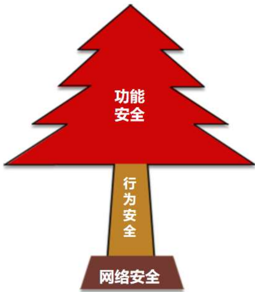
图1 网络安全和功能安全的关系

实现城市轨道交通网络互联互通可能引发安全性和隐私问题。随着不同系统之间的数据共享增多，存在数据泄漏和网络攻击的风险。这对乘客的隐私和个人信息构成潜在威胁，同时也可能影响城市轨道交通系统的正常运行。只有实现了网络安全，才能保证功能的安全。如图1所示。解决这一问题需要采取一系列安全措施，包括数据加密、网络防火墙、访问控制等，以确保信息的安全性，同时也需要制定法规和政策来保护乘客的隐私权。维护数据和网络的安全性是实现互联互通的前提，城市轨道交通系统需要制定详细的安全策略和应急计划来处理潜在的安全问题。