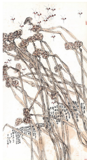
图1 江文湛 秋蓬群蜂图

周思聪是较早探索表现性水墨的画家之一，在她的代表性作品《矿工组图》之中可以看到现代构成在创作中的运用。在画面表现上，周思聪将平面构成中的分割画面，人物重叠等手法与中国水墨相结合运用其中，并且对人物形象进行了夸张变形，来表达内心的压抑与扭曲。这幅作品充满悲壮与沉郁，而周思聪正是用这种表现性水墨将人物的精神状态准确地表达出来。所有的艺术表现形式都是情感的需要，变形的人物形象与分割的画面充分展示出了矿工的苦难和侵略者惨无人道的酷刑。在《卖酒器的女人》之中也运用到画面分割的形式，较之前更显成熟。中国传统水墨线条与西方平面构成以及表现主义的手法相结合的表现形式让周思聪在探索中国水墨画更多可能性的道路上又迈出一大步。石虎在1985年创作的《无题》同样运用了画面的分块分面的艺术手法，用中国水墨材料将立体主义形式表现出来，作品显得更有一番趣味。