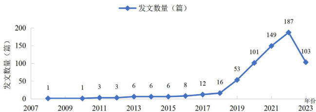
图1 旅游类课程思政研究文献产出的时间序列

旅游类课程思政各年度研究文献的产出时间序列如图1所示。从时间序列来分析，旅游类课程思政研究的文献在时间序列上整体呈上升态势，整体可划分为缓慢起步（2008—2016年）、缓慢上升（2015—2018年）和快速发展（2018—2022年）三个阶段。根据中国知网的文献搜索结果，2008年第一篇关于旅游院校思政教育的文章发表 [6] ，但真正意义上的旅游类专业课程思政研究是2012年发表的《《红色旅游资源》课程设置与高校基础学科的思想教育》 [7] 。2016年习近平总书记在全国高校思想政治工作会议上着重强调：把思想政治工作贯穿教育教学全过程 [8] ，开创了我国高等教育事业发展新局面，为旅游类课程思政研究后面快速发展提供了指引方向。